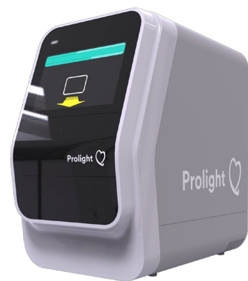
Nuvarande design. Formatet är jämförbart med tidigare visat flyttbart koncept.

Med dessa uppnådda resultat startade Prolight fas 2 i utvecklingen baserat på en prototyp med testkort och ett semiautomatiskt instrument vilket motsvarade projektets förväntningar på automatiseringsgrad och funktionalitet. För att säkerställa att den tänkta hanteringen av systemet och dess specifikationer är i linje med användarkraven har presumtiva brukare intervjuats i UK och Tyskland. Länderna är två av de största Point of Care-marknaderna i Europa. Från dessa intervjuer har mycket värdefull information ur ett handhavandeperspektiv erhållits. Ett begränsat antal patientprover har analyserats på Micro Flex-plattformen där dessa resultat jämförts med resultaten från ett stort central lab-system i sjukhusmiljö, som analyserar högkänsligt troponin. Resultaten visar att provsvaren ligger i linje med det på marknaden etablerade stora labsystemet.